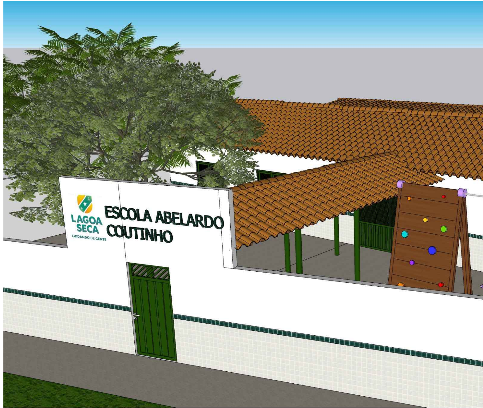
VISTA FRONTAL ACESSO