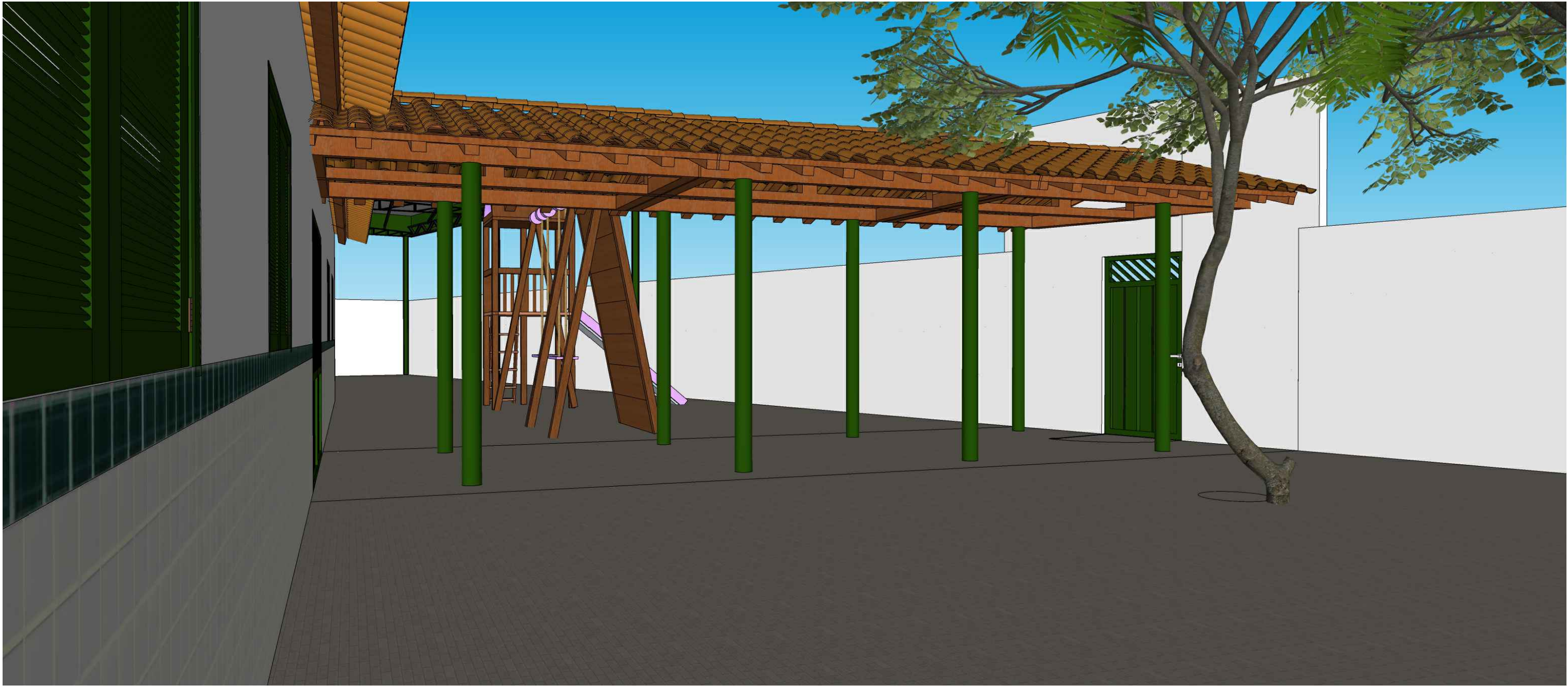
VISTA INTERNA ACESSO